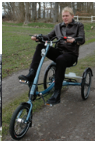
Landidylle: Das Headquarter von Used (links) Sex-Appeal: Das ScooterTrike „Urban“ (oben)